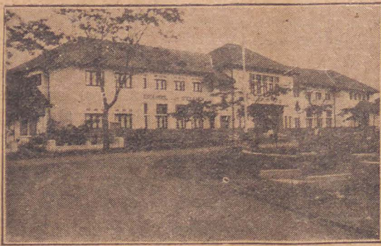
De Kweekschool te Bandoeng.

De warme, tropische zon maakte, dat het reeds 's morgens om half tien te Semarang erg heet was en toen wij de zaal van de Loge binnentraden was deze voor ons een koele, aangename schuilplaats. Voor de ziel, zoowel als voor het lichaam, zochten wij dezen morgen een schuilplaats, de plaats, waar wij verkwikking en nieuwe krachten konden opdoen voor ons geestelijk leven.